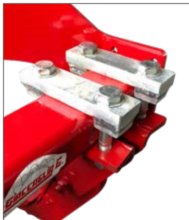
Morsetto registrabile Adjustable clamp