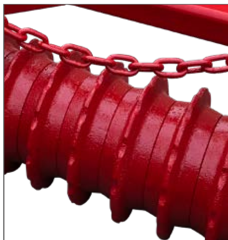
Rulli posteriori a schiena d'asino Rear donkey rollers