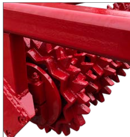
Rulli anteriori dentati Front toothed rollers