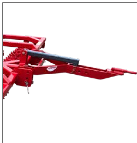
Trasformazione trainato Pulled transformation